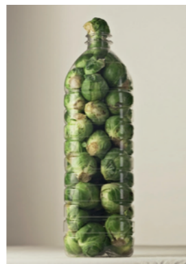
Per Johansen, DK, 21 x 30 cm # 1 B 1