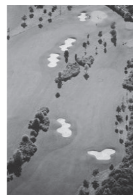
Yvonne Seidel, DE, 24 x 30 cm # 1 A 16