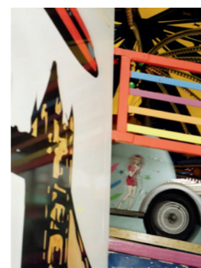
Wolfgang Zurborn, DE, 24 x 32 cm # 1 B 7