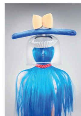
Madame Peripetie, DE und GB, 21 x 30 cm # 1 B 3