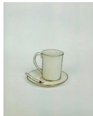
Cynthia Greig, USA, 27.5 x 21.5 cm, Handabzug, 25er Auflage # 1 B 6